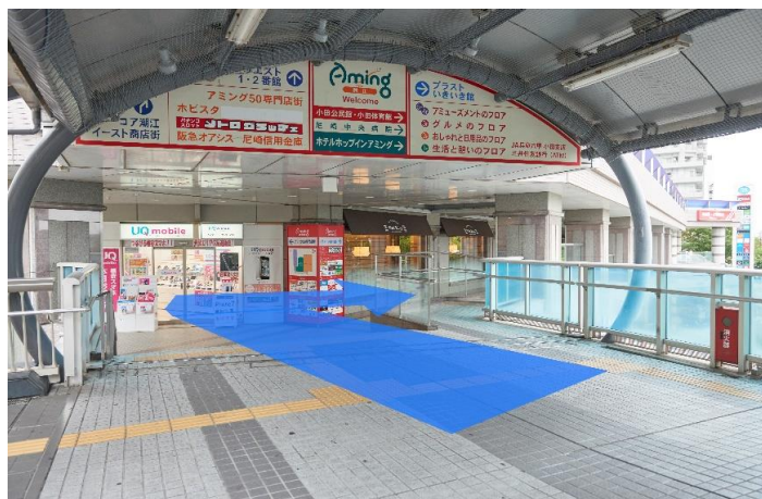
④突き当りの半階段を下り、右折・直進してください。