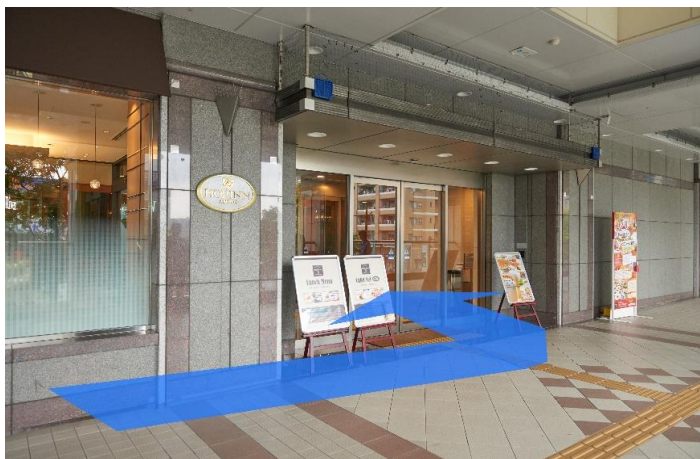
⑥ホテル2F玄関よりお入りください。