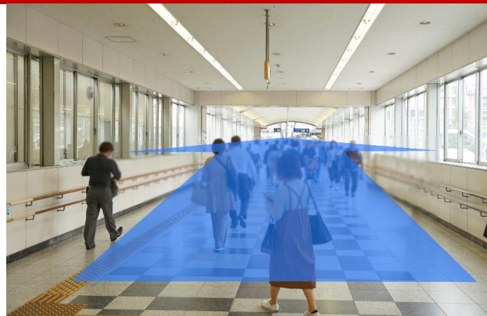
②直進してください。