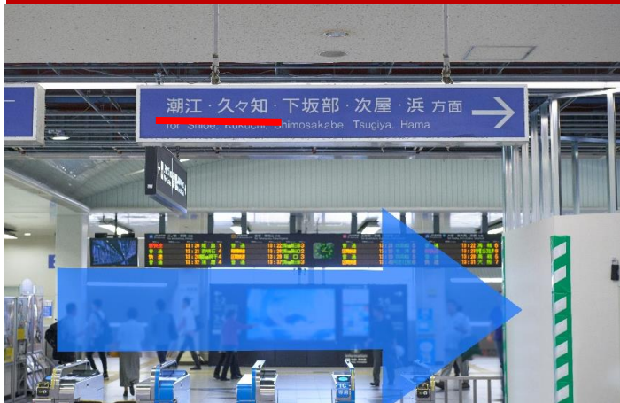
①改札口を出て潮江・久々知方面へおすすみください。