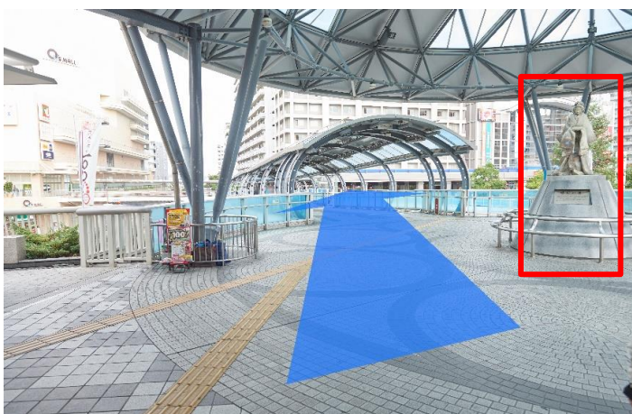
③右手に「梅川の像」が確認できます。直進してください。